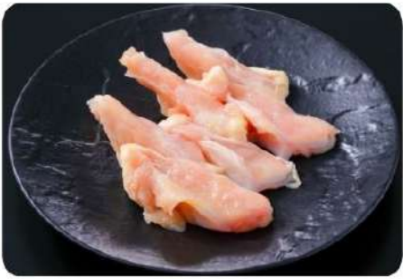
⑪若鶏ヤゲン軟骨 260円