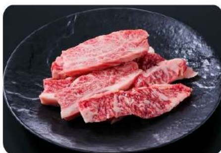
⑥和牛お買得カルビ 780円